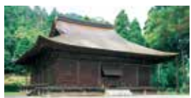
札所第33番、高浜町にある中山寺。鎌倉時代建立の本山は国の重要文化財

地図上に㊦㊧㊨と標記したお寺は「若狭三十三カ所観音霊場」の寺院(札所)。若狭は古来より京都、奈良との流通があったため寺院が多く、多くの仏像や宝物があることから「海の正倉院」「海の奈良」と称されています。人気の御朱印も集められる(一部無住の寺もあり)、観音霊場巡りを楽しんでみましょう。