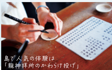
島で人気の体験は「龍神拝所のかわけ投げ」