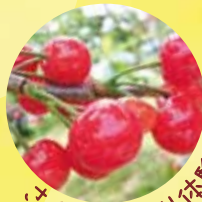
はくらんぼ狩り体験