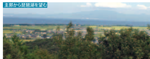
おすすめコース/新旭森林スポーツ公園-西屋敷-主郭-(往復) マップは新旭森林スポーツ公園に設置有り

西佐々木一族惣領家の城郭とされ、県下でも珍しい敵状空堀群や県下最大級の堀切が設けられています。山頂から山腹にかけて、土塁や堀切など山城遺構や、屋敷地跡が残っています。清水山城遺跡、清水山遺跡、本堂谷遺跡の範囲が、清水山城館跡として国史跡に指定されています。