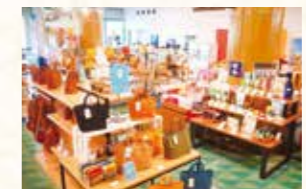
買い物スポットイメージ