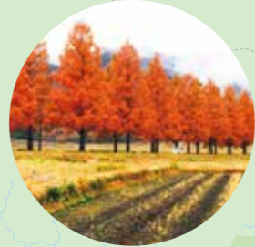
マキノピクニックランド