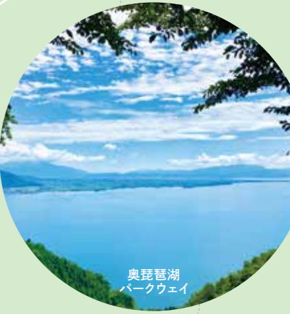
奥琵琶湖パークウェイ