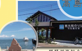
琵琶湖汽船今津港