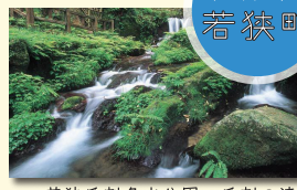
若狭瓜割名水公園 瓜割の滝