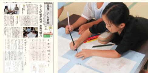
●写真はR7年度活動の様子です