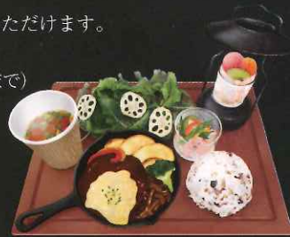
ランチプレート 1,800円

ランチメニューは、地元滋賀県産の旬のとれたて野菜をはじめ、ミニランタンパフェがセットになったお得なプレートランチです。