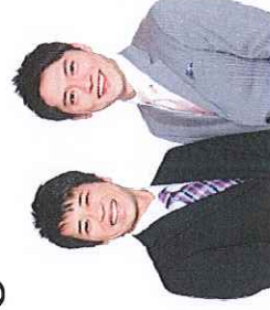
ファミリーストラン登場予定!!

「チラシ」または「ホームページ」の申込書に必要事項をご記入のうえ、 『市役所窓口（観光振興課・今津支所）』、『郵送』、『メール』、『FAX』 のいずれかでお申し込みください。