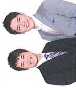
ファミリーストラン登場予定!!

「チラシ」または「ホームページ」の申込書に必要事項をご記入のうえ、 『市役所窓口（観光振興課・今津支所）』、『郵送』、『メール』、『FAX』 のいずれかでお申し込みください。