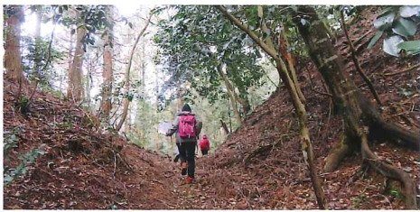
マップは田中城登り口に設置有り

西佐々木一族である田中氏の居城とされる田中城は、泰山寺野台地から舌状にのびる支丘の先端部に築かれた中世の山城で、現在も上寺区西側の山中にその遺構を残しています。主郭とされる曲輪の標高は220m、平地との比高差はわずか60mで同時期の山城と比べて標高の低い場所に位置していますが、城域の要所に堀切、土塁、武者隠しなど外敵を防ぐための遺構が見られ、相当の規模を誇る城郭であったことがうかがえます。