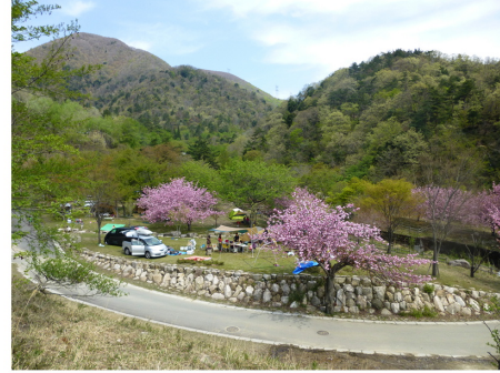
川サイトキャンプ場