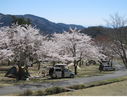
川サイトキャンプ場