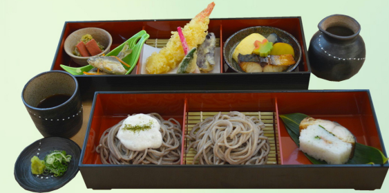
マキノ高原 蕎麦御膳

〒520-1836 滋賀県高島市マキノ町牧野931 マキノ高原管理事務所 0740-27-0936 マキノ高原温泉さらさ 0740-27-8126