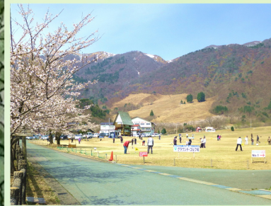
グラウンド・ゴルフ場 天然芝32ホール