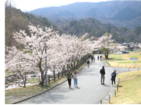
ヨキトギ川沿いの桜並木