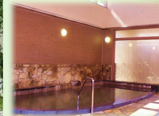
温泉さらさ 満天星