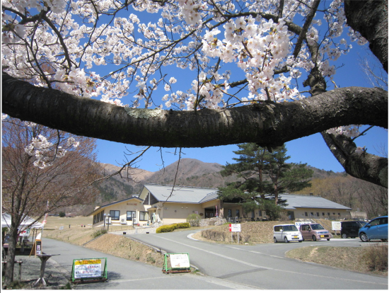
マキノ高原温泉さらさ