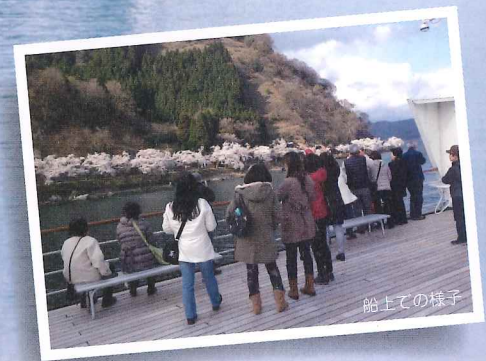
ビアンカと海津大崎の桜