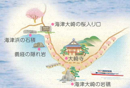
※写真はイメージです(船体を合成)